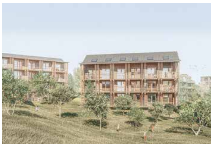
Visualisations du futur quartier du Closalet à Épalinges (VD), parc habité (en haut), hameau (en bas) (RDR ARCHITECTES)